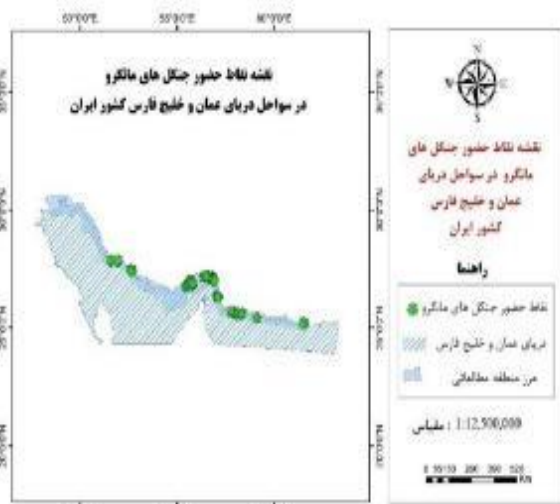
شکل ۱: موقعیت منطقه مورد مطالعه (محدوده جنگل‌های مانگرو در ایران)

نتایج حاصل از مدل‌سازی توزیع گونه‌ای حرا نشان داد متغیرهای حداقل کلروفیل، میانگین کلروفیل، مجموع حداکثر کلروفیل و pH به ترتیب بیش‌ترین تأثیر را بر پیش‌بینی حضور حرا در جنگل‌های مانگرو ایران دارند (جدول ۱، بخش ج). همچنین نتایج نشان می‌دهد در شرایط زیست‌شیمیایی حاضر بخش‌هایی از استان هرمزگان، محدوده‌ای از چابهار، شرقی‌ترین بخش استان سیستان و بلوچستان و همچنین لکه‌های زیستگاهی کوچکی در استان خوزستان بهترین مناطق برای پراکنش حرا به شمار می‌روند اما استان بوشهر به لحاظ زیست‌شیمیایی دارای حداقل پتانسیل پراکنش برای این گونه است (شکل ۳). نقشه پتانسیل توزیع گونه‌ای جنگل‌های حرا که در ۴ رده طبقه‌بندی شده نشان می‌دهد در شرایط زیست‌شیمیایی کنونی منطقه حفاظت شده حرا، منطقه حفاظت شده گابریک و جاسک، خلیج گواتر، جزیره قشم، خور آذینی، خور خلاصی، خور آبکوهی، خور احمدی، خور سمایلی و خور زنگی در مرز آبی جنوب کشور به‌طور کلی پتانسیل بیشتری برای پراکنش جنگل‌های حرا دارند (شکل ۳).